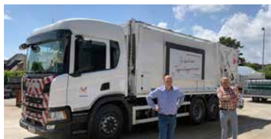
▲ Onze gemeente beschikt over een splinternieuwe vuilnisophaalwagen.