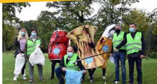
▲ Onze 'moeimakers' in het park.