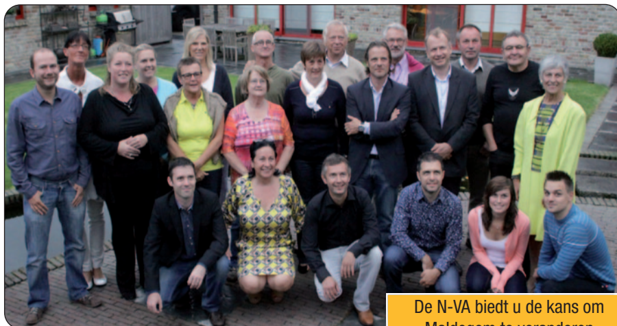
De N-VA biedt u de kans om Maldegem te veranderen